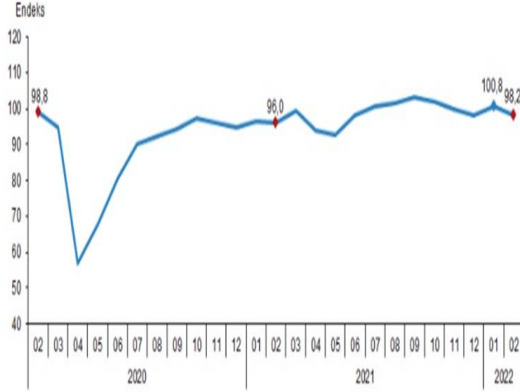
Ekonomik güven endeksi, Şubat 2022

Bir önceki aya göre Şubat ayında tüketici güven endeksi %2,8 oranında azalarak 71,2 değerini, reel kesim güven endeksi %1,8 oranında azalarak 109,9 değerini, hizmet sektörü güven endeksi %1,2 oranında azalarak 118,7 değerini, perakende ticaret sektörü güven endeksi %3,8 oranında azalarak 119,8 değerini, inşaat sektörü güven endeksi %3,3 oranında azalarak 82,7 değerini aldı.